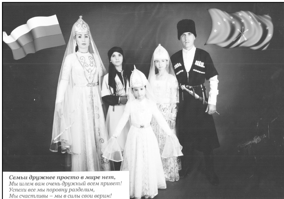
Семьи дружнее просто в мире нет, Мы шлем вам очень дружный всем привет! Успехи все мы поровну разделим, Мы счастливы – мы в силы свои верим!

Ты, даже если захочешь найти Другую такую семейку, Не сможешь, мы в мире одни И мы верно мчимся к победе!