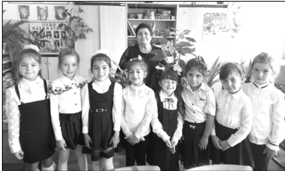
Письмо в редакцию