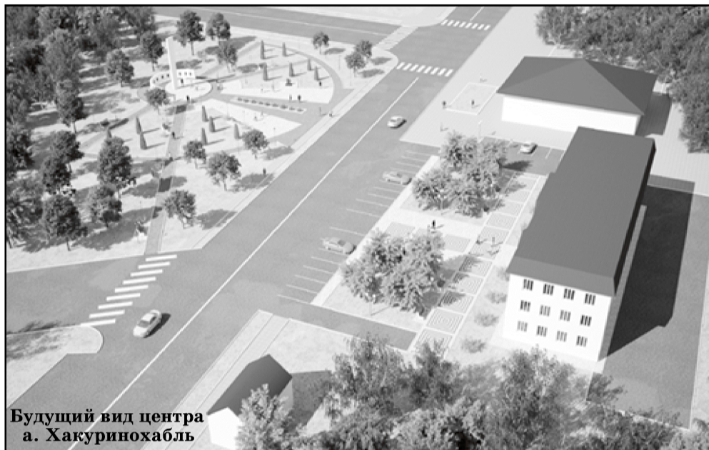
Будущий вид центра а. Хакуринохабль

Что касается спиленных деревьев, то глава района пояснил, что они давно сгнили или полусгнили, им было по несколько десятков лет, и они представляли опасность для людей. Да и не вошли эти старые деревья в новый архитектурный план благоустройства центральной части аула Хакури-